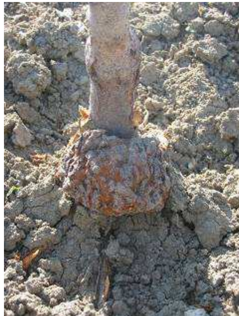
Enorme tumore batterico al colletto di un giovane albicocco

alla fase parassitaria in presenza delle radici di piante ospiti. Il batterio penetra nei tessuti radicali attraverso piccole ferite e si moltiplica rilasciando ormoni simili a quelli che stimolano la divisione e la crescita delle cellule vegetali. In tal modo si formano le tipiche escrescenze di tessuto indifferenziato che danneggiano