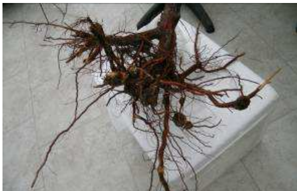
Tumore batterico al colletto di un pesco

inducono tumore sui portinnesti che derivano dal pesco (es. Franco, serie GF, Montclair, Missouri, Sirio, ecc.), indipendentemente dalla specie innestata.