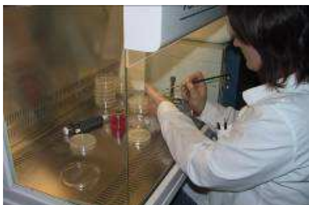
Preparazione in laboratorio delle piastre di K84

Da qualche anno, in via sperimentale e con la collaborazione del prof. Astolfo Zoina (fitobatteriologo dell'Università di Portici), il Servizio di Difesa Integrata