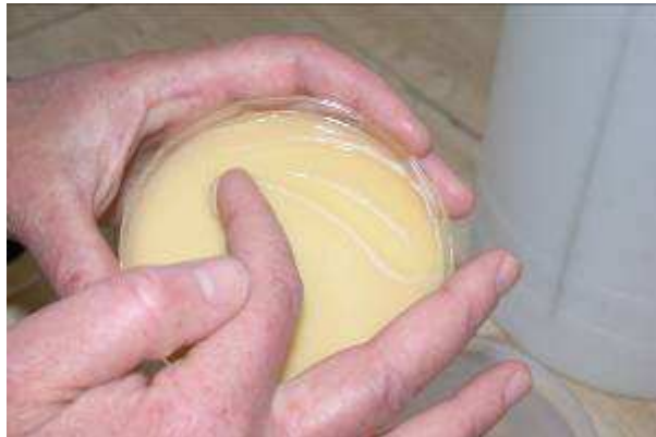
Piastra di A. radiobacter ceppo K84 pronta per la somministrazione alle piantine da trapiantare.

dell'Az. Pantanello produce presso il laboratorio dell'Azienda Pantanello il ceppo K84 che distribuisce gratuitamente ai vivaisti ed agli agricoltori che ne fanno